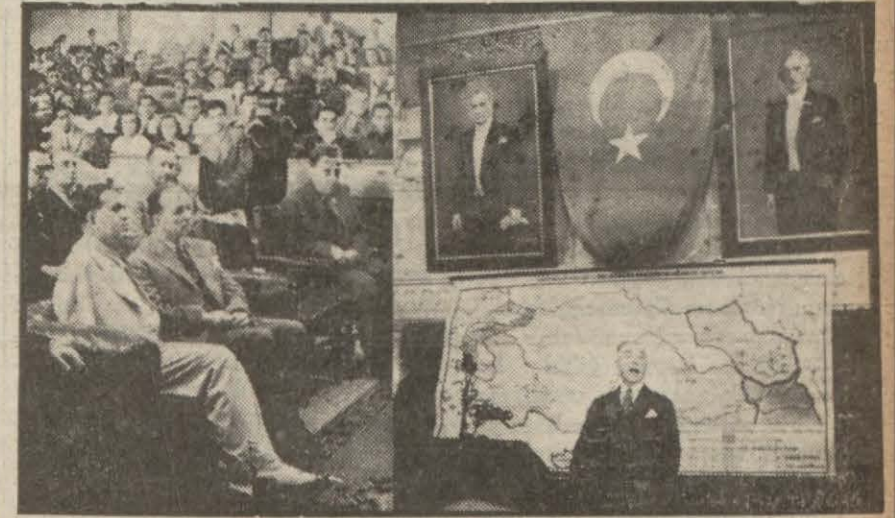
Üniversitede dünkü merasime aid iki intiba (Yazısı 2 nci sayfanın 3 ve 4 üncü sütunlarında)

Lozanın 17 nci yıldönümü bütün memleket Halkevlerinde de tesid edildi