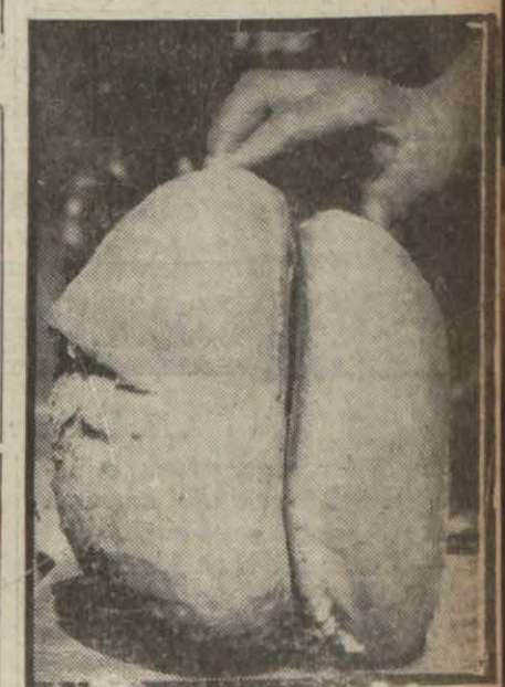
İyi pişmiş ve pişmemiş iki ekmek nümunesi

Haber aldığımız göre, bazı alâkadarlar yemekte olduğumuz ekmeklerin mide ve barsak hastalıkları tevliid ettiğini iddia etmektedirler. Buna sebep olarak da bizde buğdayın kepeği çıkarıldıktan sonra kulanılmaması olması ileri sürülmektedir. Merkezi Avrupa memleketlerinde ve Balkanlarda kepeği çıkarılmadan öğütülen buğday unlarıyla ekmek imal edilmektedir. Bu ekmek nisbeten esmer olmasına mukabil kuvvei gıdaiyesi daha fazladır. Ve diğeri gibi barsak hastalıkları tevliid etmemektedir. Bugün yemekte bulunduğumuz ekmeklerin kuvvei gıdaiyesi az olduğu kadar, kabız yapmak gibi bir zararı da mevcuttur. İşte bir kısım alâkadarlar bu noktadan hareket ederek badema ekmek imali için öğütülen buğdayın kepeğinin çıkarılmamasını tavsiye etmektedirler. Halbuki şimdi ekmek yapılan buğday, öğütülen unlardan % 79 nisbetinde elde edilmektedir. Geri kalan kepek olarak atılmaktadır ki, bu kepek buğdayın kuvvei gıdaiyesini fazlalattırmağa âmil olmaktadır. Birçok muhalifleri bulunan bu tez karşısında tanınmış mütehassıslarla görüşmek istedik. Kimyager doktor Cevad Tahsin Tin diyor ki: